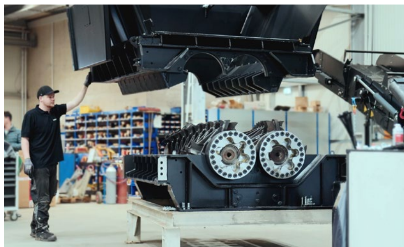
Foto zeigt das Abnehmen der Oberschale am QC

Wellenwechsel mit QC in unter 90 Minuten. Kompletter Austausch des Brecherwerks in nur 45 Minuten.